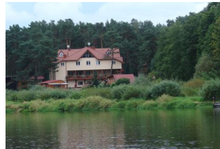
Urocz w Serpelicach